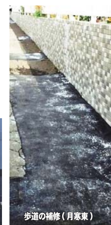
歩道の補修（月寒東）