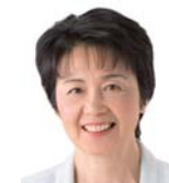
紙智子 参議院議員