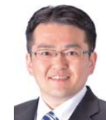
はたやま 前参議院議員