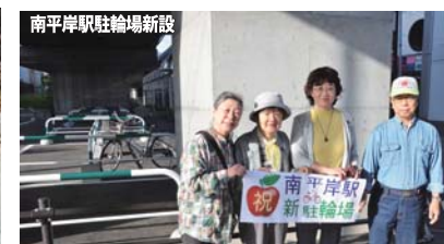
南平岸駅駐輪場新設