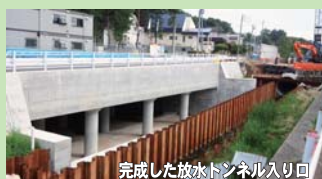
完成した放水トンネル入り口