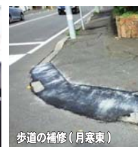
歩道の補修（月寒東）