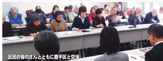
区民の皆さんとともに豊平区と交渉