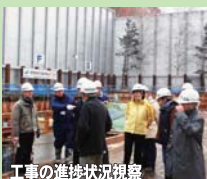
工事の進捗状況観察

西岡中央公園脇からトンネルを掘削し、洪水時に豊平川に水を流す工事が、平成31年の完成を目指し、進んでいます。